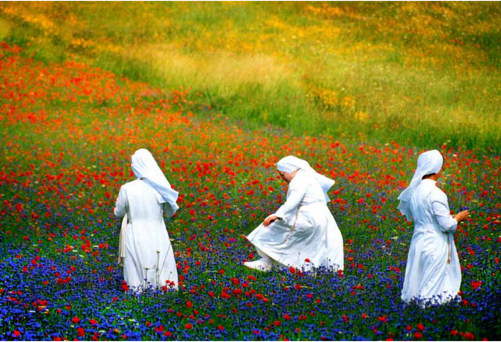
Riccardo Pesaresi (Italy)