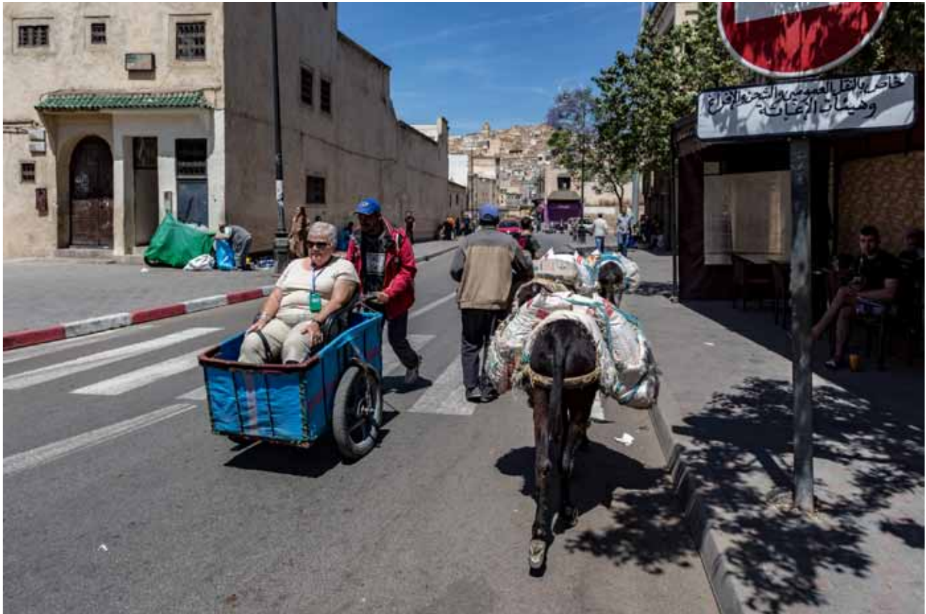
Doron Talmi (Israel)