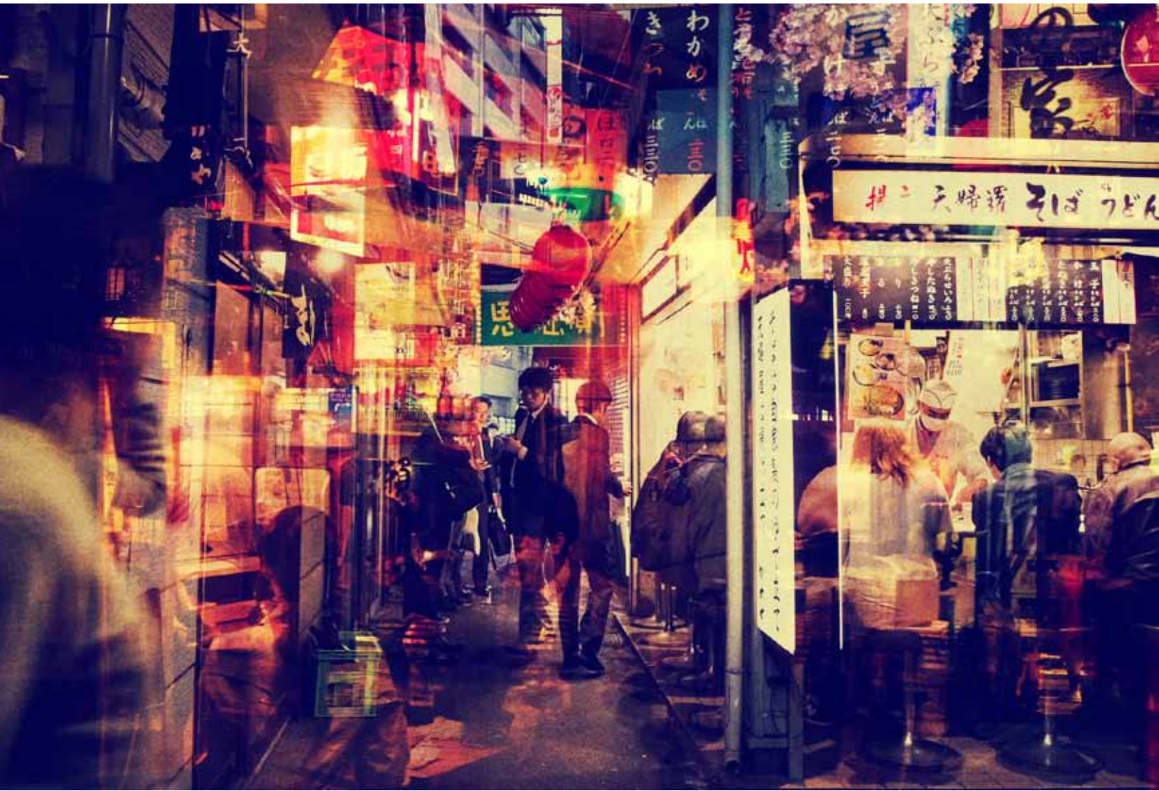
Davide Paoli (Italy)