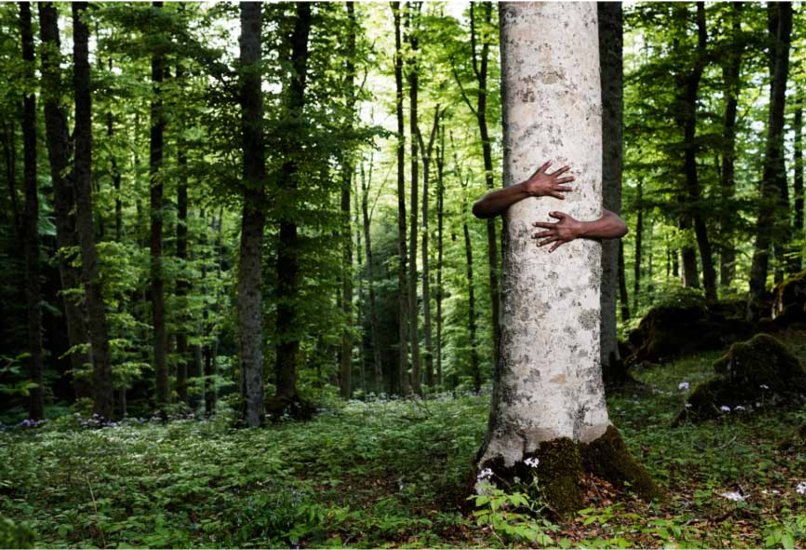
Sandro Di Camillo (Italy)