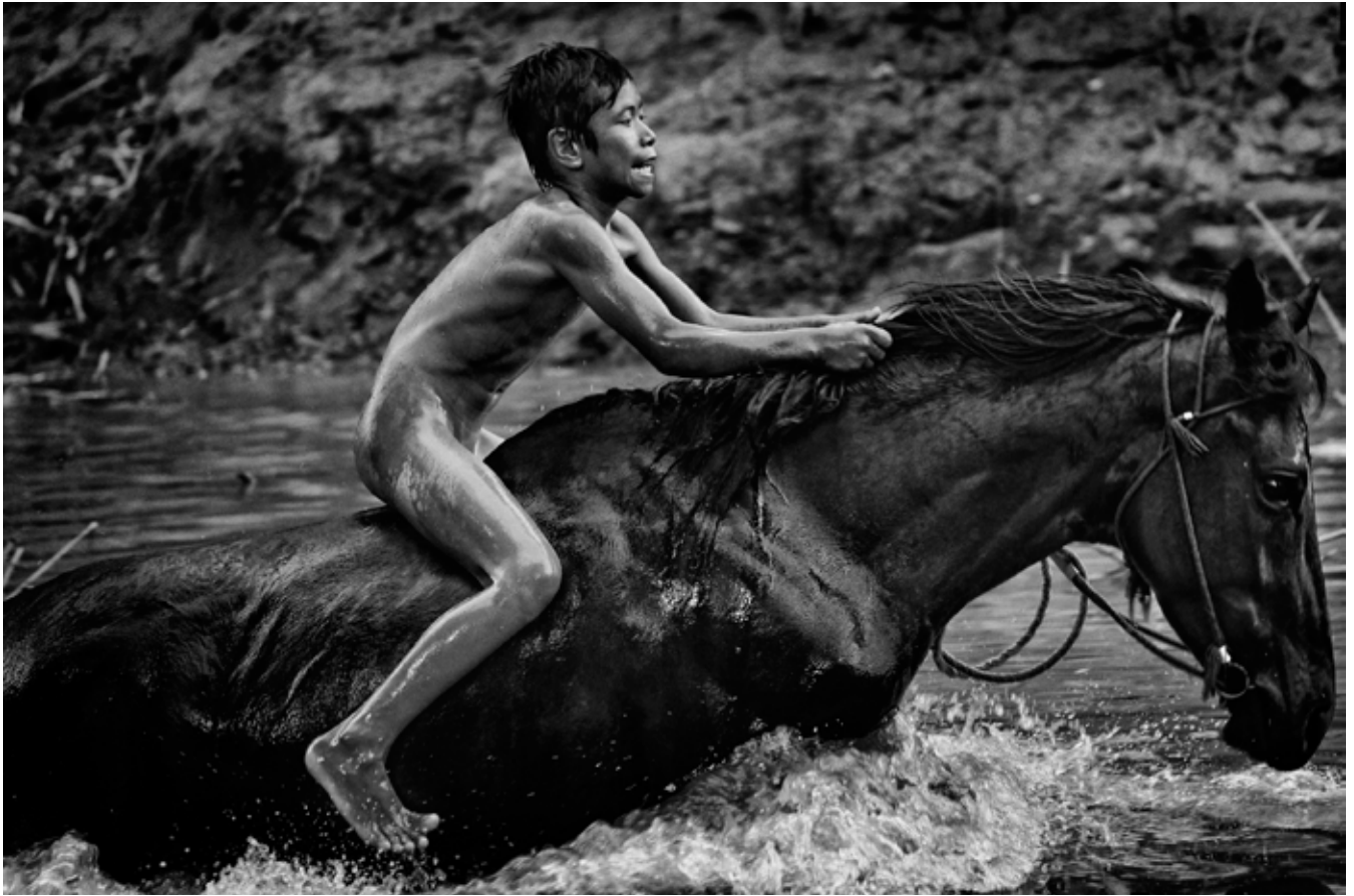
Alain Schroeder (Belgium)